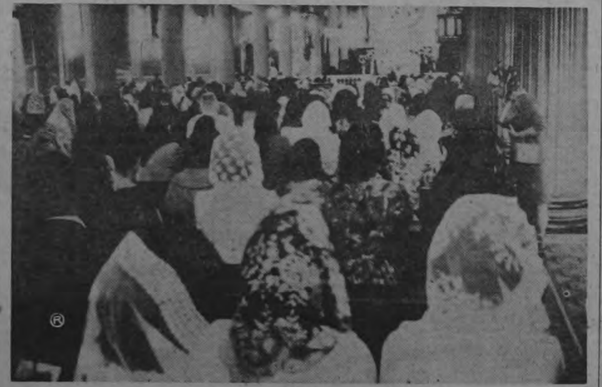
Cientos de mujeres cubanas y costarricenses, hermanadas por el mismo sentimiento doloroso de tantos combatientes caídos en Cuba en defensa de sus ideales, y cuya sangre caerá sobre el déspota Fidel Castro y la tenebrosa camarilla comunista que gobierna la desdichada isla, asistieron ayer devotamente a las cinco de la tarde a una misa que con tal motivo fue convocada en la Catedral Metropolitana. Las tres naves de la iglesia estaban totalmente llenas. Había gente de pie por todas partes.